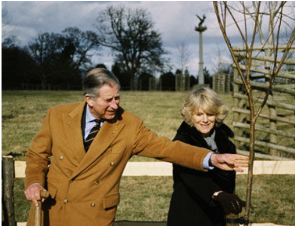
Y Tywysog a'r Dduges yn plannu coeden ar Stad Highgrove.

Bu Tywysog Cymru'n tynnu sylw at faterion yr amgylchedd ers llawer o flynyddoedd. Yn ystod 2005-06, ymdrechodd Ei Uchelder Brenhinol yn ddyfal trwy areithio, gwneud cyfweliadau yn y cyfryngau, a chw'rdd ag arweinwyr busnesau er mwyn tynnu sylw at bryderon mwy a mwy o bobl am yr amgylchedd ac i annog cwmnïau ac unigolion i leihau effeithiau niweidiol eu gweithgareddau ar y byd naturiol.