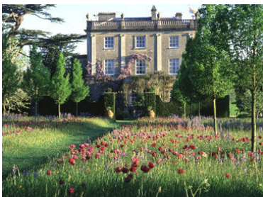
GU H-ÀRD Taigh Highgrove.